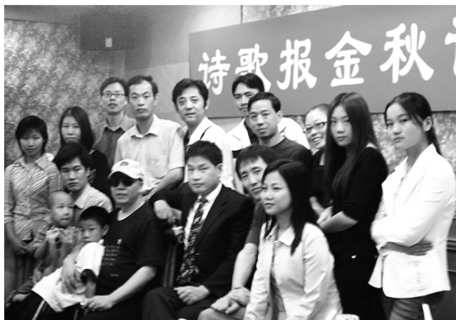
上图：2004年10月，小鱼儿在诗歌报金秋诗会（广州）