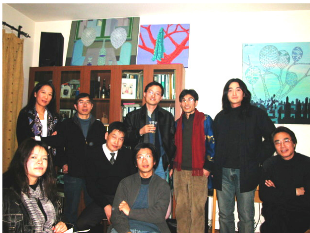
小鱼儿和他的朋友们

2004年1月31日，农历正月初八，纽约、北京、南京、苏州等地的诗人来到上海，在严力画室小聚、谈诗，留影。