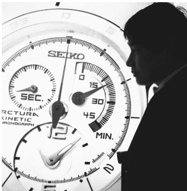
上图：2005年1月在上海南京路一广告牌前留影