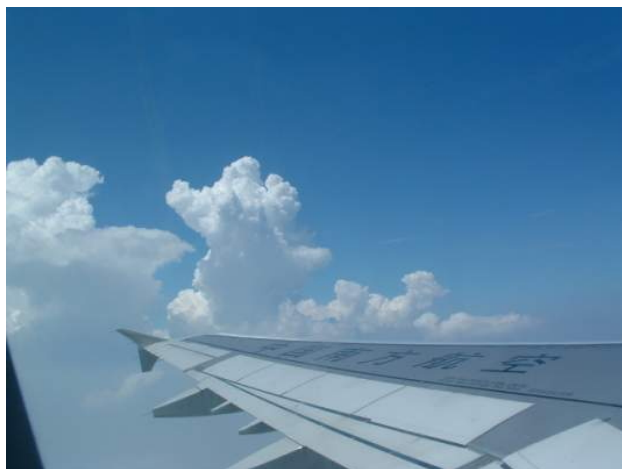
上图：空中鸟瞰大连