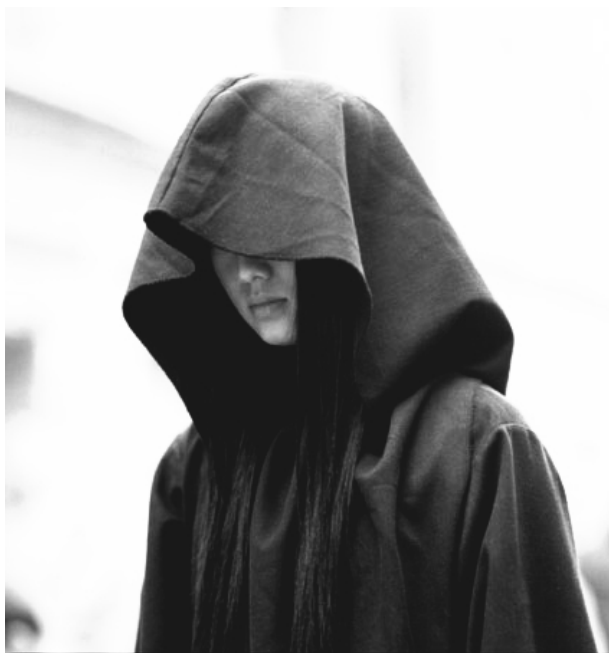
上图：网络图片《回家》（在线问题诗歌写作范图）