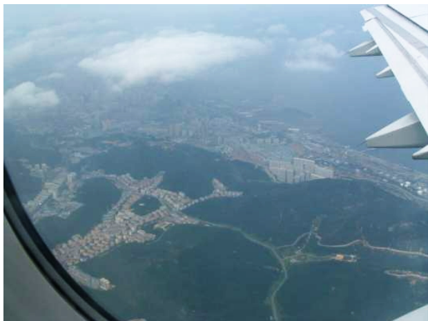
上图：空中鸟瞰大连