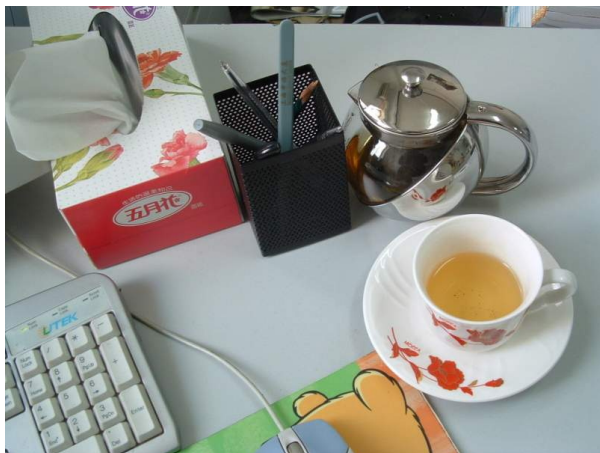
小鱼儿的办公桌 一杯茶、几本书、一点点音乐